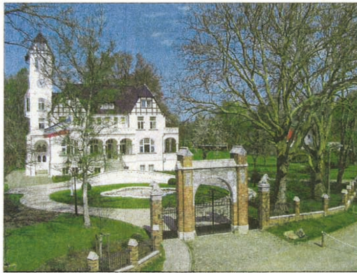
Schön und gepflegt zeigt sich das Anwesen der „Villa Papendorf“.